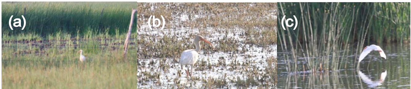
Figura 2. Registros fotográficos de ibis blanco adultos ( Eudocimus albus ) de la Zona Media de San Luis Potosí: (a) individuo registrado el 22 de septiembre de 2011, (b) individuo registrado el 26 de febrero de 2012, y (c) individuo volando registrado el 26 de febrero de 2012; se aprecia la coloración negra de las puntas de las alas (cuatro primarias externas).